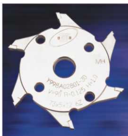
磨邊刀(6齒) BEVELING CUTTER φ73×6Z