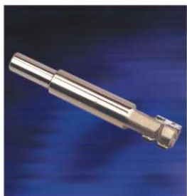
圓角刀(2齒) CORNER BEVELING CUTTER (2 teeth)