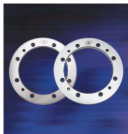
裁板刀 SHEAR CUTTER