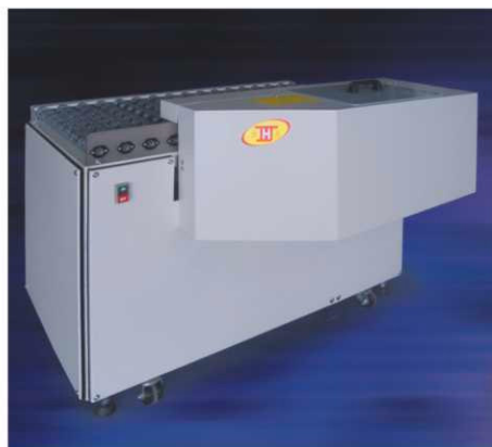
JH-298自動磨邊機(單機型)