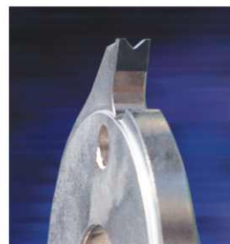
鑽石晶片 DIAMOND TIP