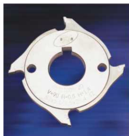
磨邊刀(4齒) BEVELING CUTTER φ83×4Z