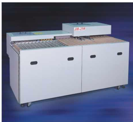
JH-250圓角磨邊機(單機型)